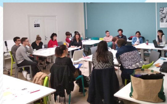
Rencontre du collectif jeunesse et ESS, espace de coopération et partage d'outils pédagogiques